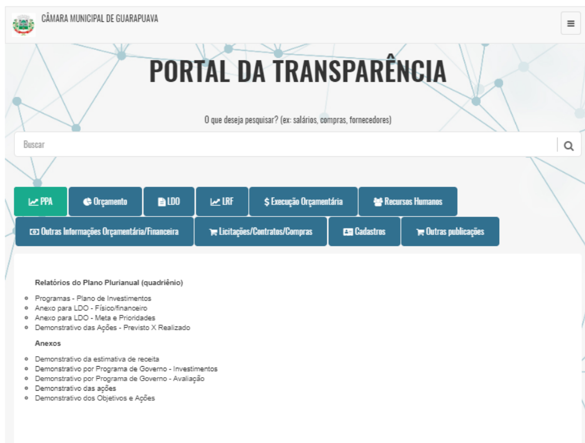
Figura 1 – Portal da Transparência da Câmara